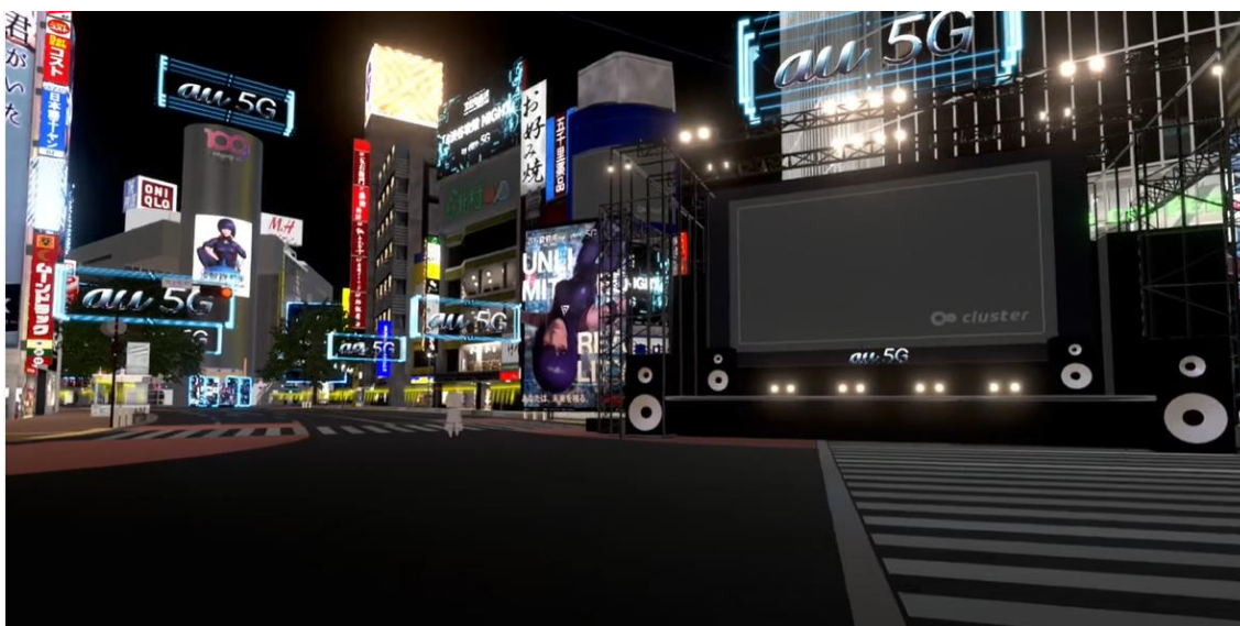
(参考図 2) バーチャル渋谷

(バーチャル渋谷 体験ビデオ https://www.youtube.com/watch?v=1huL3qPm9JI 0:01 より。以下同ビデオにつき URL を省略。)