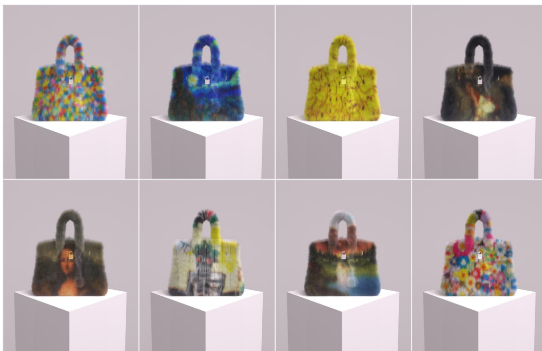
(参考図1) メタバーキン NFT

(Metabirkins のウェブサイト https://metabirkins.com/ より)